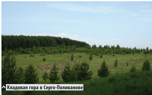
▲ Кладовая гора в Серго-Поливанове

Там же краевед конкретизирует место: «Вблизи Поливанова, на пригорках правого берега реки Вад, на так называемой Кладовой горе, до сих пор существуют остатки сторожевого укрепления, городка, с которым